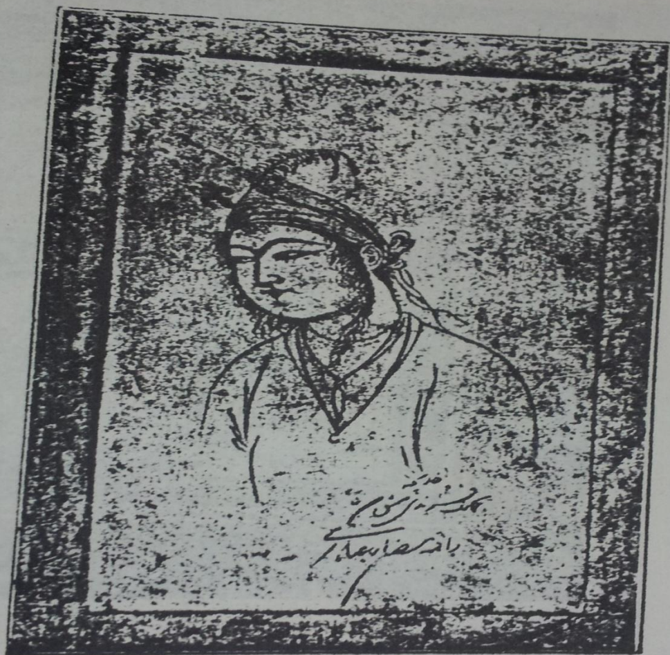
شكل ٨٧٦ - سيدة . تصويرة للمصور (مكرر) رضا عباسى فى القرن السابع عشر . من مجموعة راينو