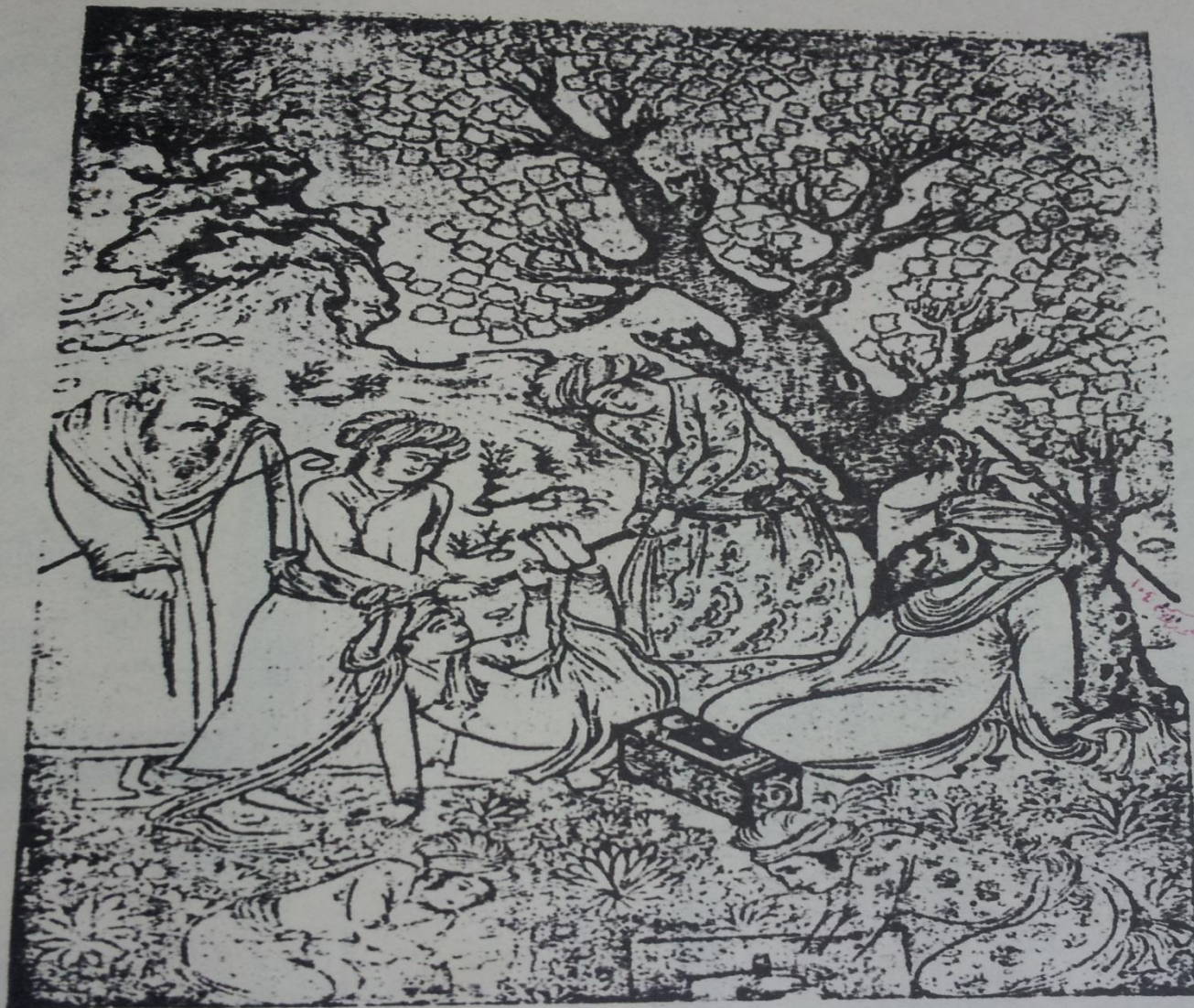
شكل ٨٩٣ - ضرب « بالفلقه » . تصويره للمصور الايراني محمد قاسم سنة ١١١٤ هـ ( ١٧٠٣ م ) .