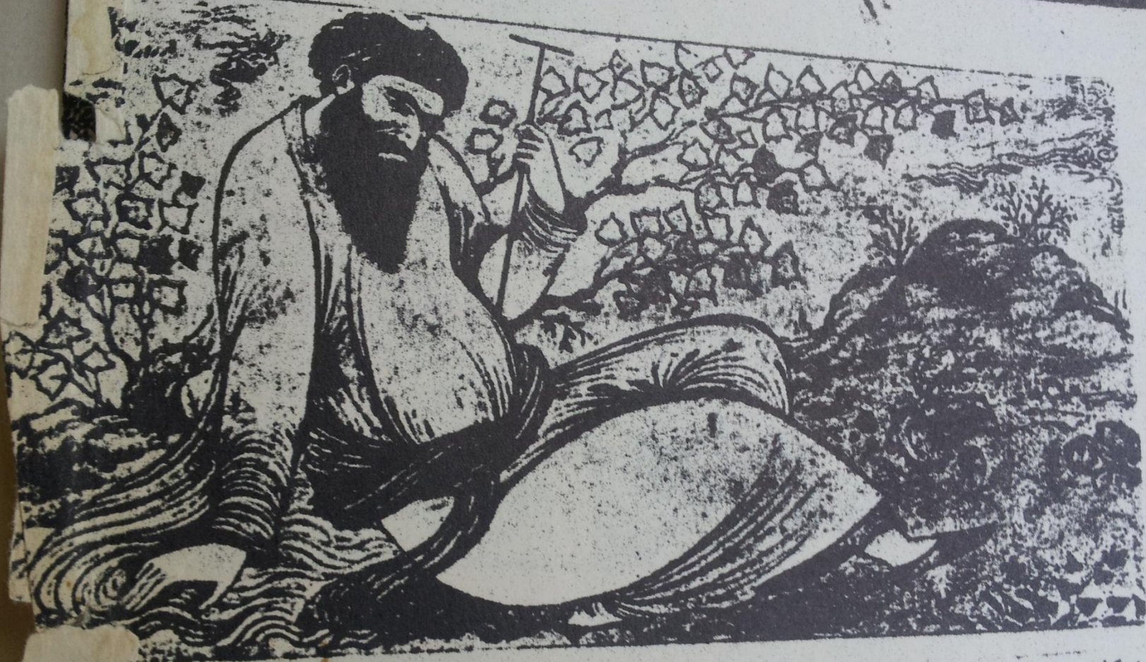
شكل ٨٨٢ - شيخ يستريح . تصويرة للمصور الإيراني رضا عباسي سنة (١٦٢١ م) . في المكتبة الأهلية بباريس (مكررا)